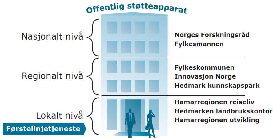
Figur 1: Aktører for tilrettelegging av næringsutviklingen i Hamarregionen

De ulike virkemiddelaktørene 2 som har en rolle i å bistå næringslivet til vekst og utvikling er skissert i fig.1 under. Disse har ulike roller, og følger i all hovedsak opp nasjonal og regional politikk for næringsutvikling.