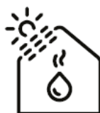
Solfanger Få inntil 15 000 kroner