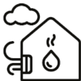
Luft-til-vann-varmepumpe Få inntil 20 000 kroner