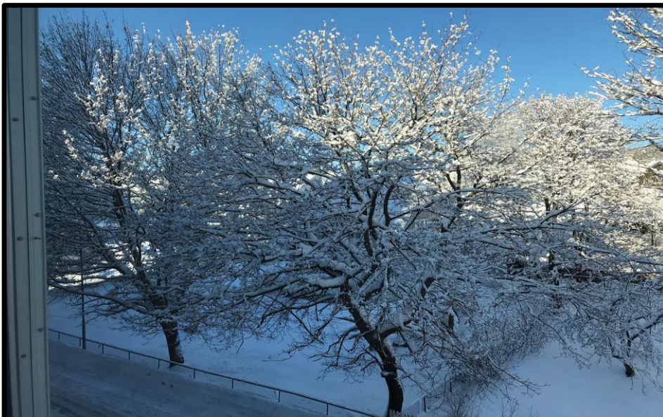
Bilde: Klimaet kan være en utfordring.

Etter hvert vil alt gå bra, men vi må være tålmodige og slite for å få et bedre liv og tilpasse oss det norske samfunnet og følge lover og regler og fokusere på fremtiden.