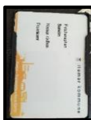
Bilde: Mange arbeidsplasser har id-kort