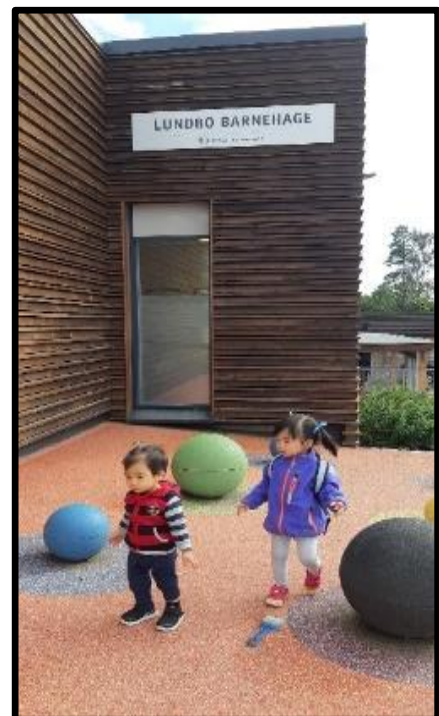
Bilde: Ute i Lundbo barnehage

Dessuten leker ikke barna ute i Vietnam, bare inne i barnehagen.