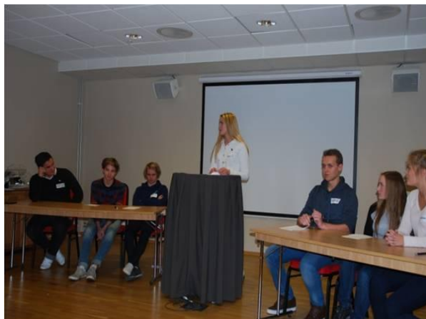
Ungdomsrådet i Hamar.

Hamar skal bli best på medvirkning for barn og unge.