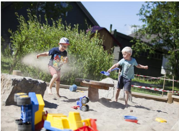
Dagligliv i Hamar.

Livskvalitet handler om å oppleve glede og mening, om å bruke personlige styrker, føle interesse, mestring og engasjement. Livskvalitet har nær sammenheng med helserelaterte gevinster som bedre fysisk- og psykisk helse, sunnere livsstilvalg, sterkere nettverk og sosial støtte. Opplevd livskvalitet er viktig for den enkelte. Det kan bidra til gode familierelasjoner, oppvekstkår, fungering i arbeidslivet og for befolkningens generelle helse. God psykisk helse medvirker dermed til oppnåelse av et bredt utvalg helserelaterte og sosialpolitiske mål.