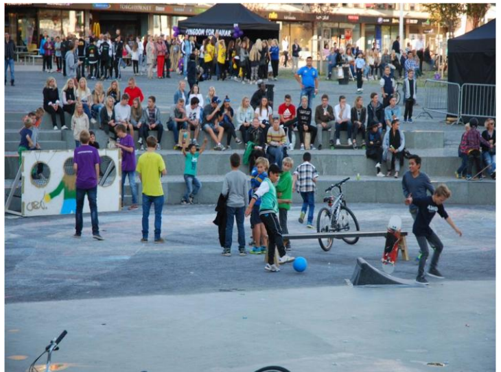
Fra åpningen av Stortorget september 2014.