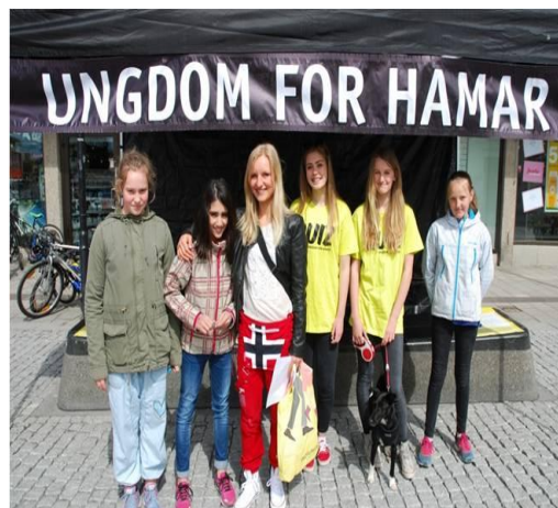
Fra åpningen av Stortorget september 2014.

Det er gjort store satsninger rettet mot barn og ungdom i Hamar kommune de siste årene. Bygging og utbedring av skoler og barnehager, bygging av kulturhus med et variert tilbud, nye og utbedrede idretts- og fritidsanlegg, samt by- og stedsutvikling har preget utviklingen. En dimensjon ved dette er at medvirkning av og med barn og ungdom selv har stått sentralt i arbeidet. Da nytt stortorg åpnet i september 2014, var det med barn og ungdom i sentrum for en storstilt mønstring som trakk tusenvis av mennesker til byen! Disse satsningene kommer i tillegg til naturgitte forutsetninger Hamar har for å kunne drive aktivitet med Mjøsa og Vangsåsen som to av flere viktige områder. Folk i Hamar engasjerer seg gjennom frivillighet i et organisasjonsliv med en imponerende bredde.